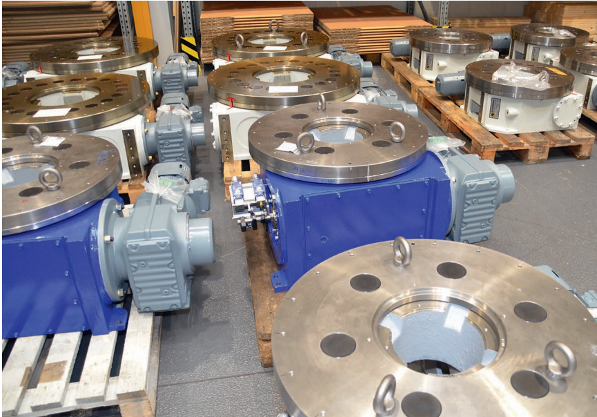
2 Solche Drehtische für den Automobilbau sind das Kernprodukt in Lorsch. Es gibt sie standardmäßig in 16 Varianten von 350 bis 3200 mm Durchmesser

chung im Durchmesser, in der Höhe und im Planlauf sowie von H7-Qualitäten bei den Passungen.«