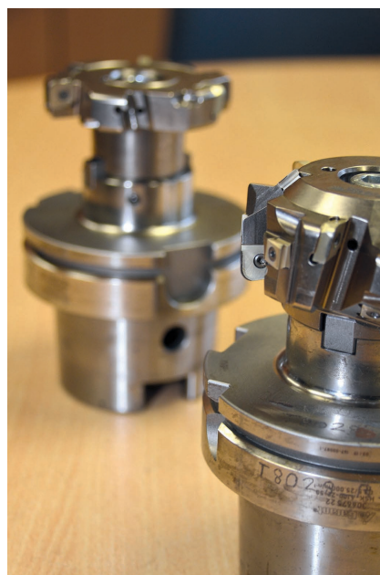
4 Jeder Xtra Kontur trägt wie hier rechts in der 80-mm-Version zwölf verschiedene Wendeschneidplatten. Hinten der Schlicht-Scheibenfräser Xtra MT 90